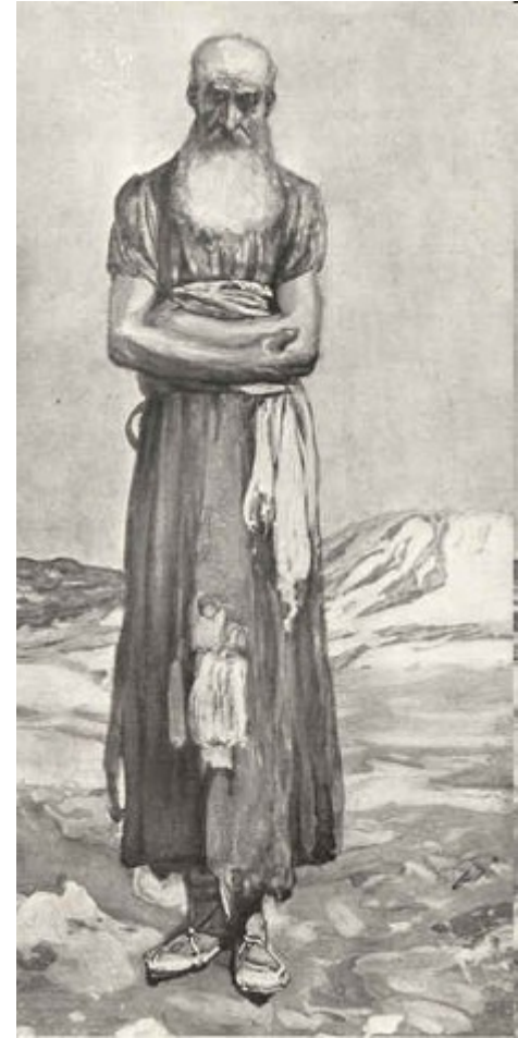
James Tissot 1836-1902; Prorok Nahum