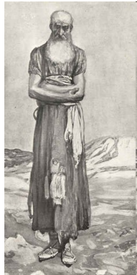
James Tissot 1836-1902; Prorok Nahum