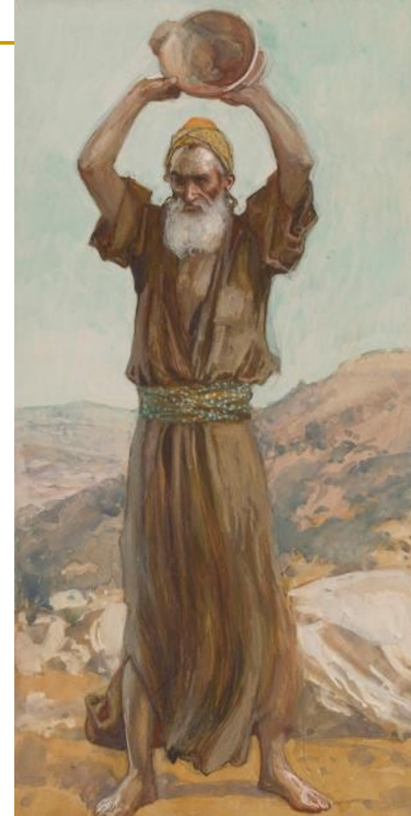
J. Tissot, Jeremija razbija glinenu posudu