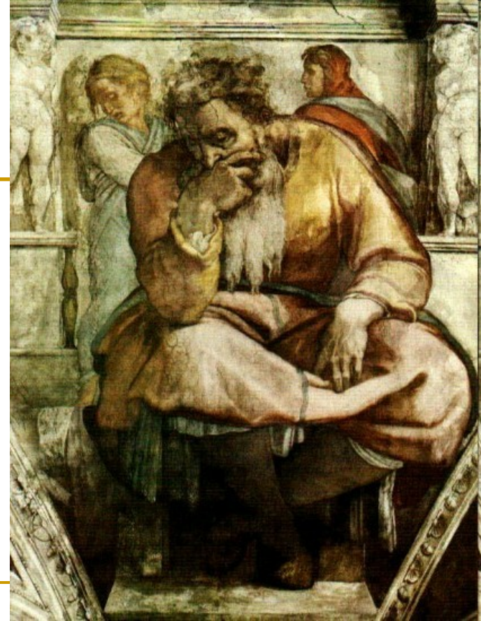
Michelangelo, Jeremija, Sikstinska kapelica