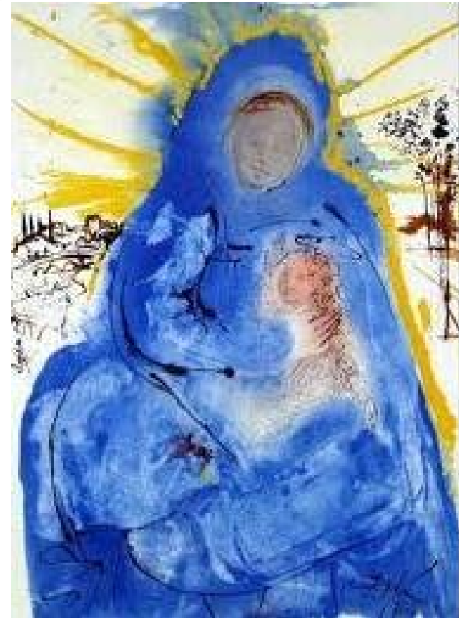
S. Dali: Djevica će roditi sina